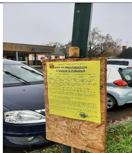
Rue du Mortier Plat ouest