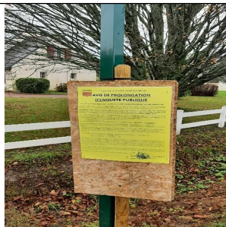
Rue du Mortier Plat est