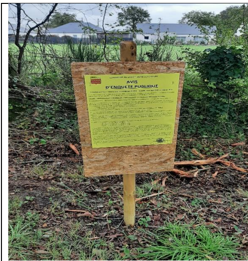
Affichage école rue de la Forge