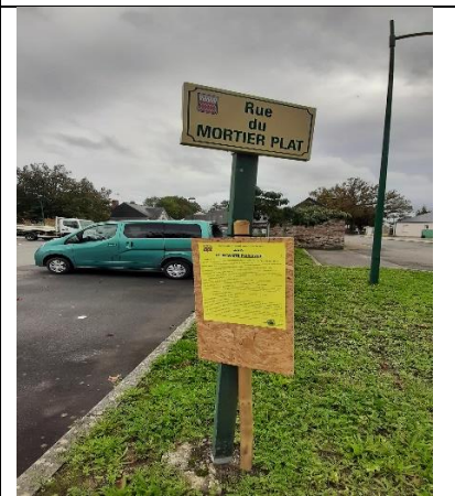
Affichage rue du Mortier Plat ouest