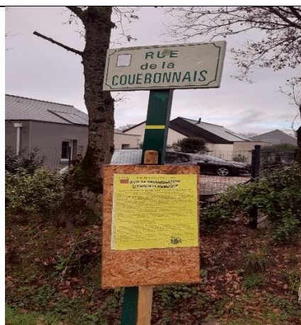
Rue de la Coueronnais est