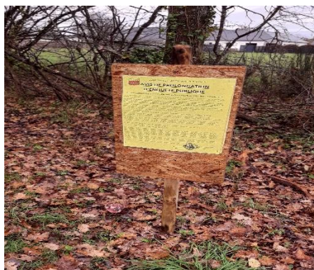
Rue de la Forge