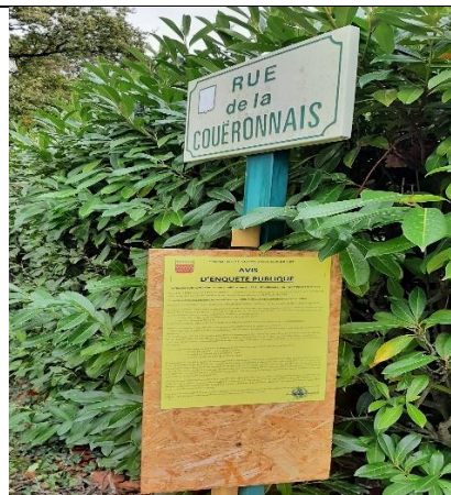
Affichage rue de la Coueronnais ouest