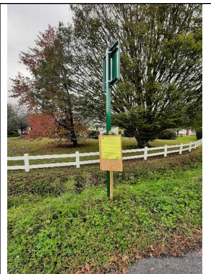
Affichage rue du Mortier Plat est