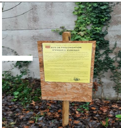
Rue des Pinsons