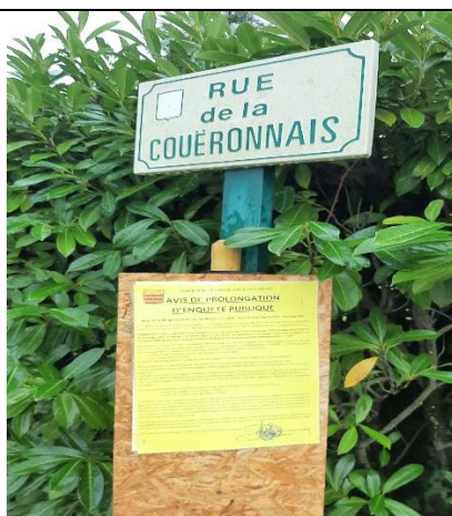
Rue de la Coueronnais ouest