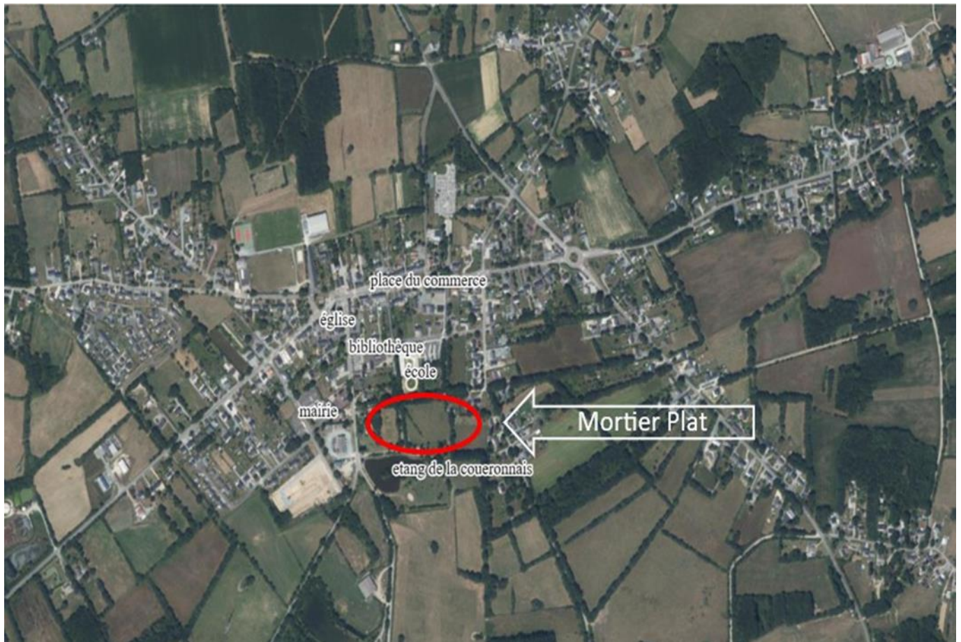
Photo aérienne du Centre de la commune de Sainte Anne sur Brivet

Enquête publique ouverte initialement du samedi 28 octobre au lundi 27 novembre 2023 inclus par arrêté municipal n° 2023-10-01 du 10 octobre 2023 puis prolongée jusqu’au 8 décembre 2023 inclus par arrêté municipal n° 2023-11 -04 du 13 novembre 2023