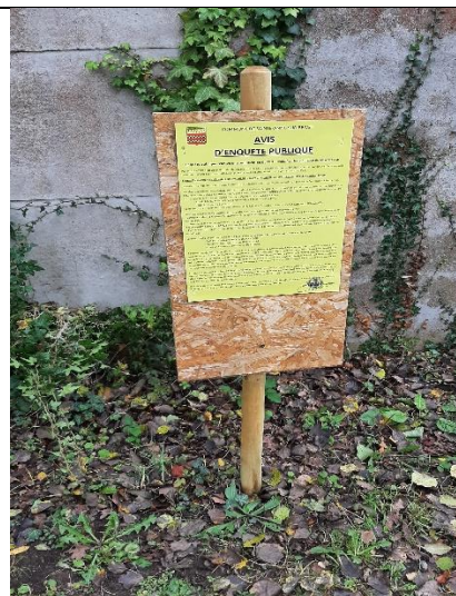
Affichage rue des Pinsons