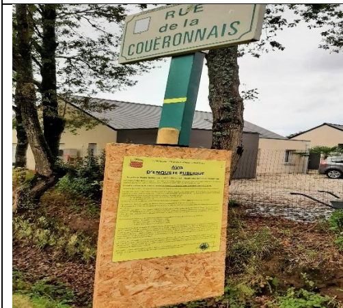
Affichage rue de la Coueronnais est